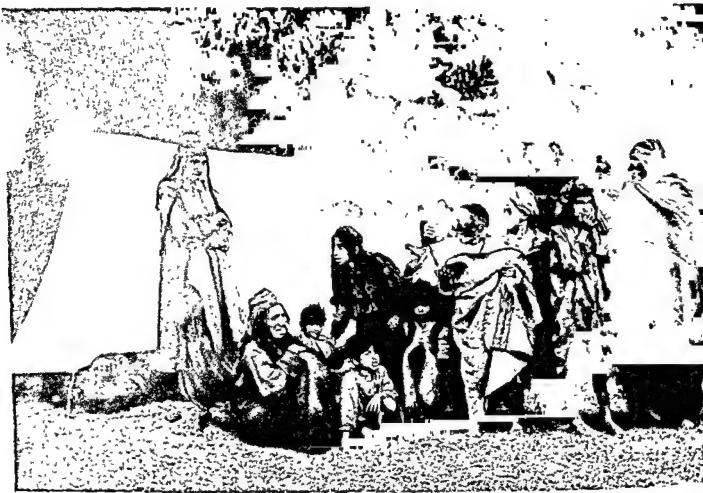
गुजरों का डेरा